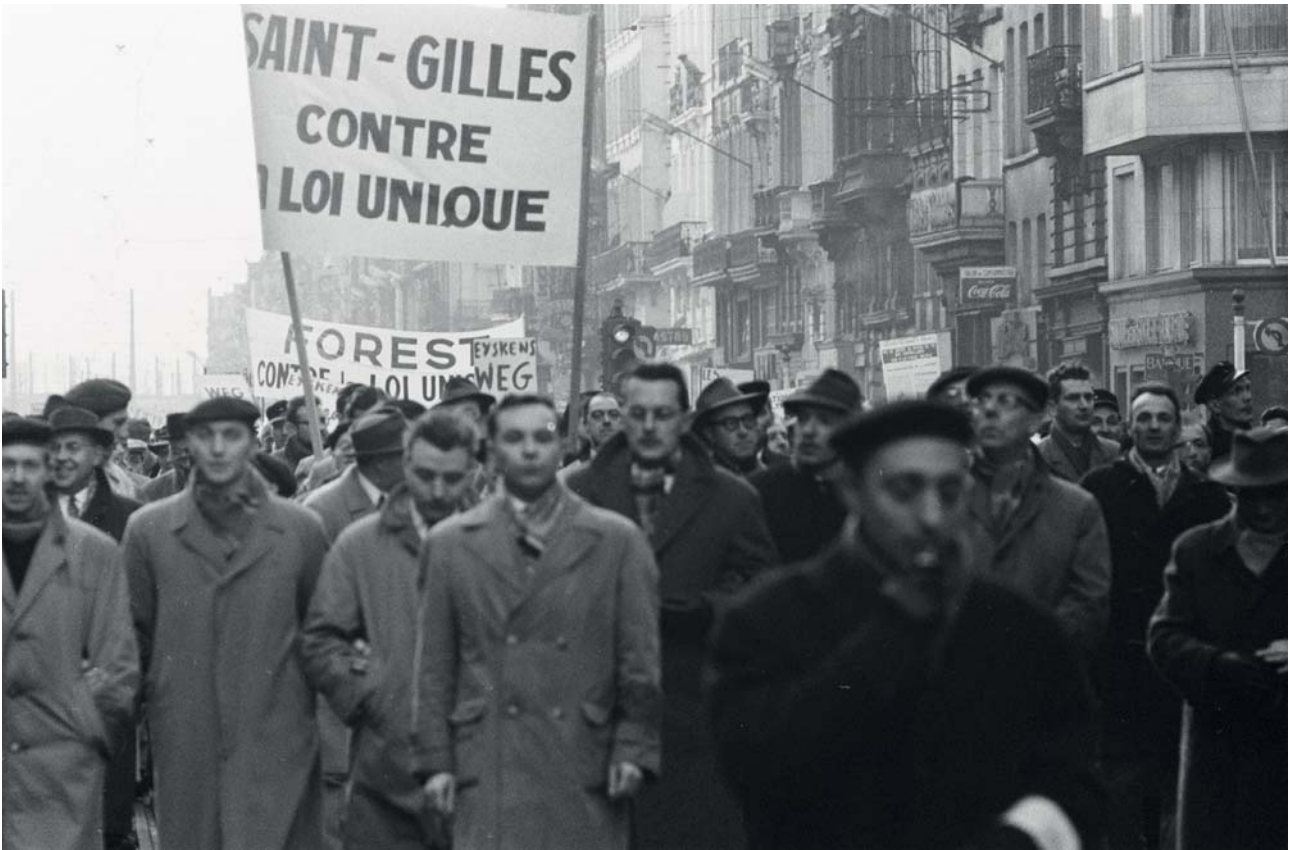
Manifestations à Bruxelles contre la loi sur l'Union, démonstrations de grévistes - Composante no_911-9323