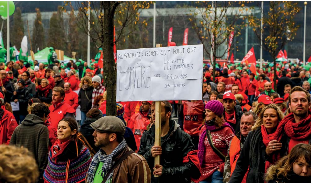
Bruxelles - Manifestation nationale jeudi 6 novembre 2014 - En route vers la Gare du Midi (Vol 3)

2. Observez les images, décrivez-les : que représentent-elles pour vous ? Quelles idées suggèrent/défendent-elles ? Comment jugez-vous les réalités représentées ?