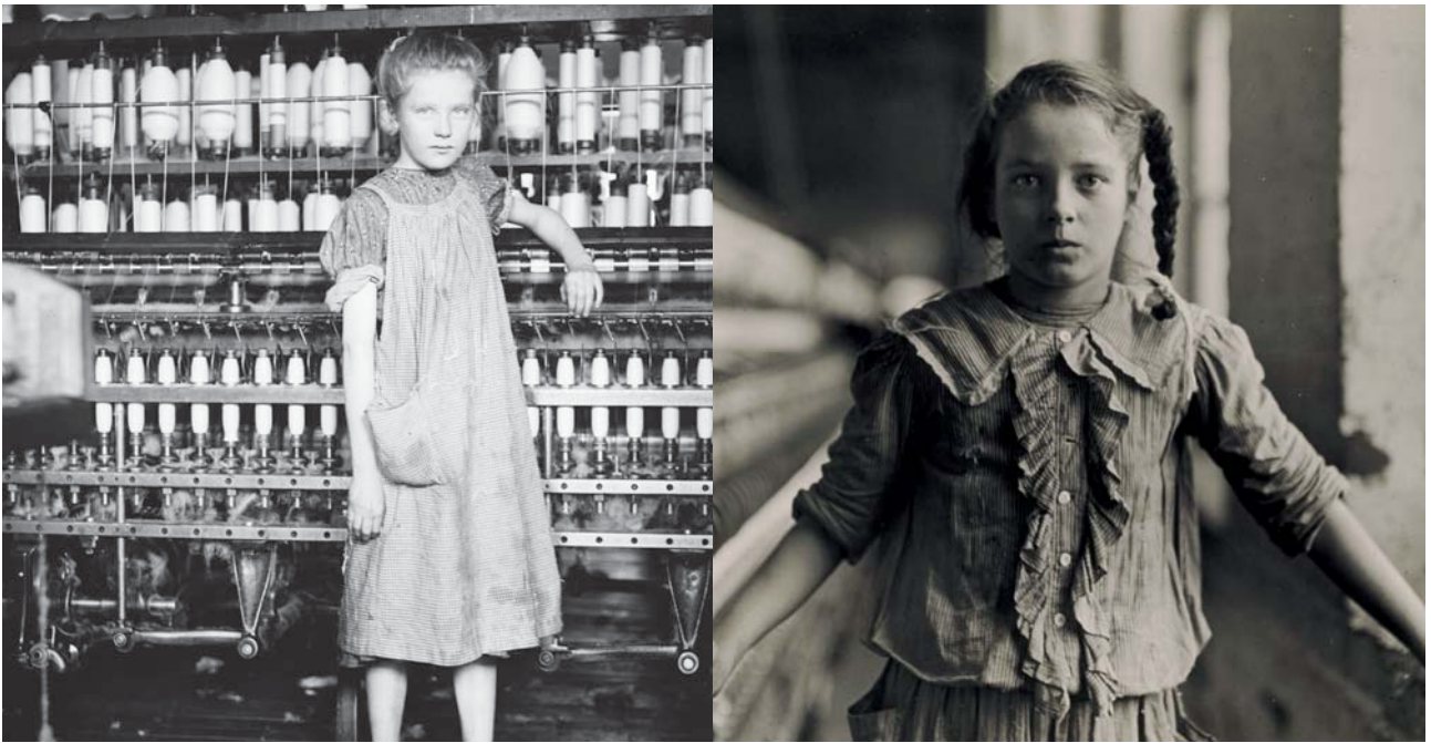
Travailleuses textile américaines (Lewis Hine, 1909) - ©Wikimedia Commons