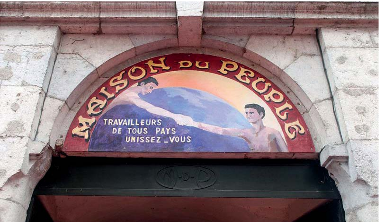
« Maison du Peuple à Saint-Claude (Jura). » Pmau (12/07/2016) « Maison du Peuple à Saint-Claude (Jura). » Pmau (12/07/2016) - ©Wikimedia Commons